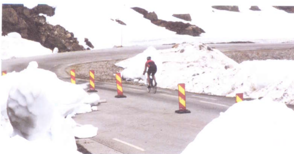
Det går stadig ras rundt Trollstigen.

www.visitgeirangerfjorden.com , www.frafjordtiffjell.com